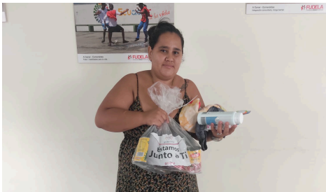
Entrega de kits de alimentos con el apoyo de SNOB