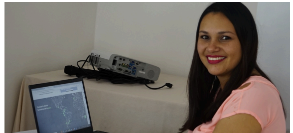
Fortalecimiento de habilidades digitales con el apoyo de Fundación Telefónica