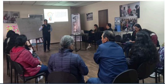
Personas en movilidad humana fortalecen sus conocimientos en emprendimiento gracias a General Motors