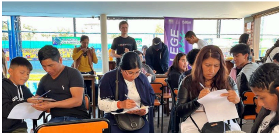
Sesiones formativas que empoderan a jóvenes beneficiarios con el apoyo del arte para ser activistas y alzar la voz en temas cruciales.