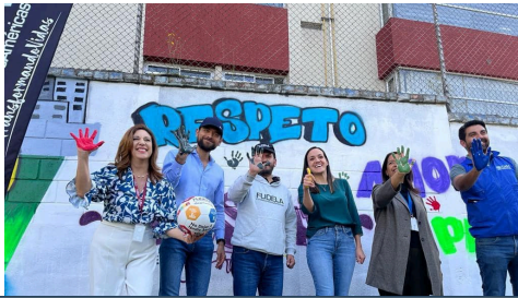
Parque Futuro: Generando oportunidades a través del Deporte con la participación del Ministerio del Deporte, ACNUR, OIM y otros aliados