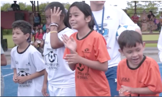
Partidos finales y premiación del segundo macro torneo comunitario de fútbol mixto del proyecto Goles por la Vida y los Sueños.