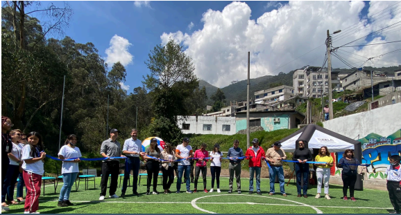
Cancha Deportiva construida por parte de voluntarios General Motors y otros aliados en la Comuna.