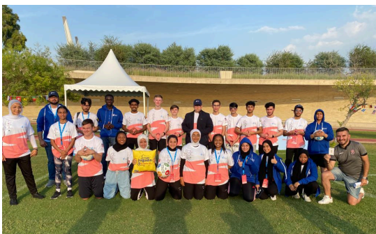
Fudela fue parte del Festival Goal 22 de Generation Amazing Supreme Comitte for Delivery