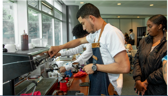
Talleres de Barismo junto a Nestlé