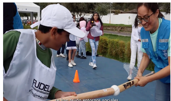
Cierre del proceso Campeones Comunitarios, fortaleciendo los derechos de Niños, Niñas y Adolescentes a través del deporte.