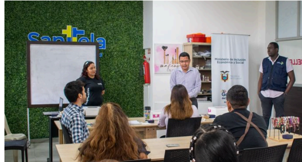
Presentación de negocios por parte de emprendedores, en el marco del programa de Capital Semilla.