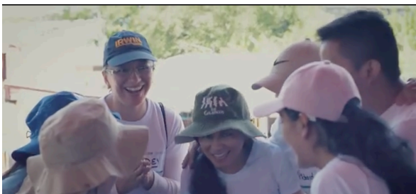
En Lago Agrio, se lleva a cabo un encuentro con las instituciones aliadas del GTRM compartiendo mediante actividades lúdicas.