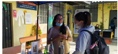
Participación de iniciativas sostenibles de FUDELA en la Feria de la Salud del Medio Ambiente