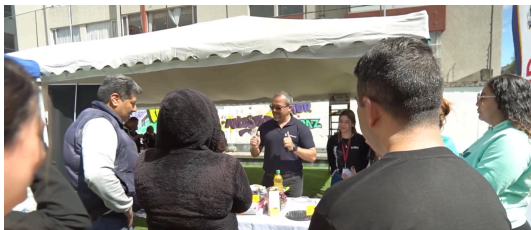
Espacio de educación financiera para participantes en el marco del proyecto Inclusión Financiera de USAID