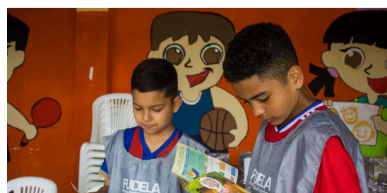
Niños y niñas de Santo Domingo participan en el challenge Ahorra para Cuidar la Fauna gracias a la alianza con Diners Club