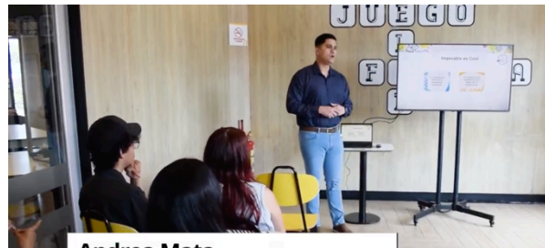
Capacitaciones sobre modelo exitoso de negocio y técnicas de manipulación de alimentos